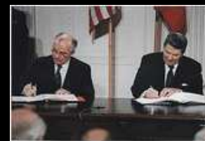
Dicembre 1987: trattato di non proliferazione delle armi nucleari

Francois Furet, Il passato di un'illusione. L'idea comunista nel XX secolo - Arnoldo Mondadori - 1995