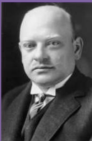
Gustav Stresemann Berlino, 1878 – 1929

Nel 1923, con la nomina a cancelliere di Gustav Stresemann, leader del Partito Popolare, le cose cambiano profondamente. Stresemann prova, e con successo, a far cessare gli scioperi e a riannodare il confronto con gli alleati vincitori, in particolare con la Francia. Dopo la breve esperienza come cancelliere, Stresemann è nominato ministro degli esteri e in questo ruolo, con la collaborazione del ministro degli esteri francese Aristide Briand, è responsabile del Patto di Locarno con cui Germania, il Belgio, Francia, Gran Bretagna e l'Italia s'impegnano a garantire le frontiere franco-tedesca e germano-belga (1925), l'ingresso della Germania nella Società delle Nazioni (1926) e il trattato di non aggressione russo-germanico. Nel frattempo gli Stati Uniti varano il Piano Dawes a sostegno dell'economia tedesca. L'economia riprende fiato: finanziari americani e inglesi concedono prestiti. La stabilità della Germania pare un fatto acquisito.