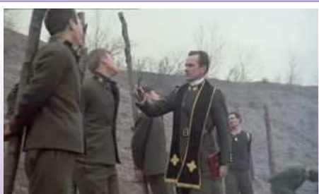
dal film “ Uomini Contro ” di Paolo Risi

Nell'estate del 1914 il governo delega a Joffre (generale in capo) l'adozione di tutte le misure necessarie. Vengono istituiti dei consigli di guerra speciali nella zone di combattimento, le cui sentenze non hanno appello e vengono eseguite immediatamente. Ma dal 24 aprile 1915 il potere politico reintroduce le garanzie per gli accusati, come pure le circostanze attenuanti e la domanda di grazia presidenziale. Nel 1917 i militari fecero annullare queste concessioni.