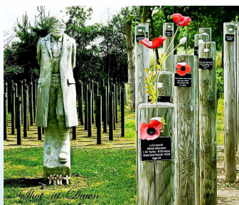
Shot at dawn memorial Staffordshire Arboretum

Ma la guerra si dimostrò brutale. Tutti i generali si dimostrarono ottusi perché inviarono all'assalto uomini armati solo di fucili, contro mitragliatrici e cannoni. Di fronte alla carneficina tutti si trovarono impreparati. La stragrande maggioranza dei soldati compì il proprio dovere, ma alcuni impazzirono e pochi disertarono. Al fronte, giorno dopo giorno si contava la scomparsa degli amici (interi battaglioni non rientravano in trincea alla sera dopo gli assalti), senza sapere a chi e quando sarebbe toccato la prossima volta.