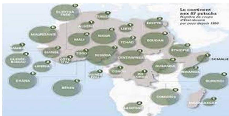
Gli 87 colpi di Stato in Africa

stato, tengono in ostaggio i governi civili, si collocano al di sopra di particolarismi e ideologie, intendendo con ciò svolgere il ruolo di arbitri tra i contendenti. I colpi di stato con regimi militari aumentano col passare del tempo: alla fine degli anni Ottanta se ne contano ormai ventitré. E' assente una norma giuridica per la successione al potere,