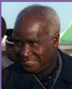
Kennet Kaunda, (Chinsali, Zambia 1924)

Gli insufficienti mezzi a disposizione, i costi dei servizi sociali che i nuovi governi si sentono in dovere di garantire alle popolazioni per una maggiore equità, si tradurranno quindi in una nuova forma di dipendenza dai paesi più avanzati di entrambi i blocchi. Lo "scambio ineguale" , tra