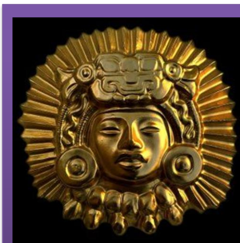
Maschera di Atahualpa

Gli spagnoli sapevano o intuivano che catturando il sovrano peruviano avrebbe significato decapitare l'esercito avversario.