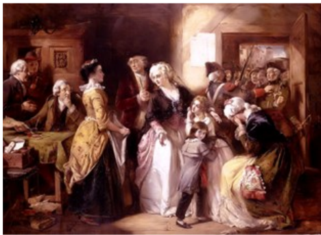
Arresto a Varennes della famiglia reale

autorità locali vengono avvertite e quando i reali giungono a Varennes trovano la strada sbarrata dalla Guardia Nazionale e devono pernottare in una locanda; a Varennes, infine, giungono anche gli ussari: il loro comandante chiede ordini, ma Luigi non vuole che si sparga sangue francese (e di questo gli va dato merito) e li licenzia. Così, mentre il fratello, conte di Provenza e futuro Luigi XVIII, che era partito contemporaneamente, raggiunge senza intoppi il confine belga, Luigi viene arrestato con la famiglia e ricondotto sotto scorta a Parigi, dove giunge tra due ali di folla ostile, in pratica prigioniero dell'Assemblea. Non aiutava certo il manifesto da lui lanciato al momento della sua partenza, per condannare