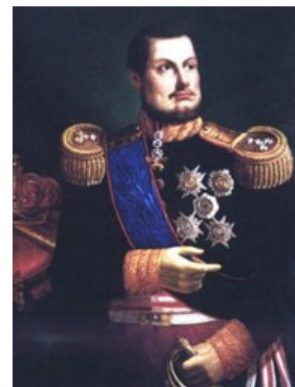
Ferdinando di Borbone

Quella reazione non fu solo economica. Divenne politica, poi diplomatica, e infine militare. La Royal Navy sfilò minacciosa nel golfo di Napoli. A quel punto, il problema non era più lo zolfo. Era la