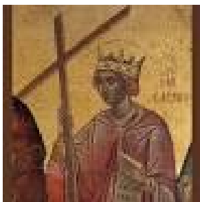
Sant'Elena (250 ca.d.C. - 329 d.C.)

Infatti, benché, come già detto, si venerassero le reliquie dei santi martiri ad corpore (presenti con il loro corpo) giustiziati dall'impero romano, la scoperta della Vera Croce ha consentito di introdurre il culto delle assai più preziose reliquie del Signore .