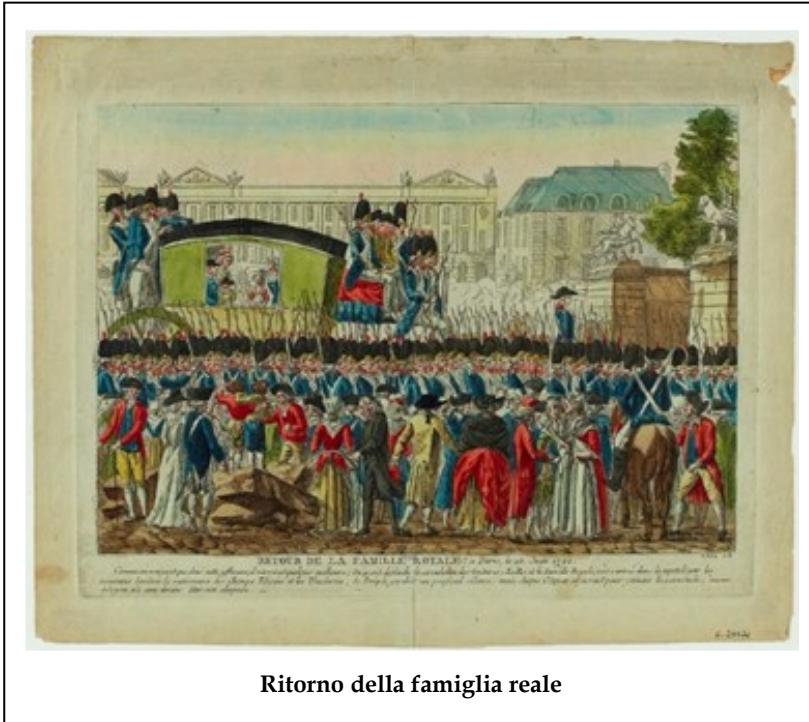
Ritorno della famiglia reale

La borghesia, che aveva fino a quel momento guidato la Rivoluzione, non intendeva rinunciare alla monarchia ; l'istituto era ancora saldamente radicato nell'animo dei francesi e costituiva, ai loro occhi, un argine alle istanze estremiste ed egualitarie, che potevano condurre a ciò che più la borghesia paventava, la distruzione del diritto di proprietà . L'Assemblea, d'altro canto, non disponeva di alternative valide a Luigi: i fratelli erano emigrati, il cugino, l'Orleans, non sembrava affidabile, si circondava di avventurieri come Danton; chi poteva garantire, inoltre, che una