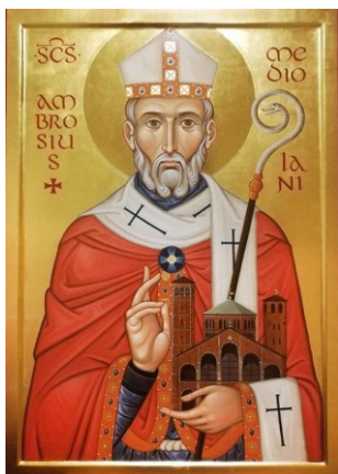
Sant' Ambrogio Vescovo di Milano (Treviri, 335 ca. – Milano, 397)

L'occasione si verificò, sempre nel 386, quando il vescovo si apprestava a consacrare la basilica ambrosiana (che già nella sua denominazione dava l'idea della personalità di Ambrogio) con le ossa dei martiri. Ma a Milano le persecuzioni cristiane erano state molto poche e quindi non era facile trovare sepolture di martiri. Tuttavia Ambrogio sapeva dove trovarle e ne organizzò l'esumazione.