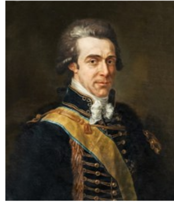
Hans Axel von Fersen, (Stoccolma, 1755 – Stoccolma, 1810)

la fuga da Parigi con tutta la famiglia. La fuga viene preparata con cura nei giorni precedenti la data fissata, 20 giugno 1791, sotto la regia di un cortigiano, Boilieu, e di Axel Fersen (a destra), un nobile svedese, probabile amante della Regina ai tempi di Versailles; Fersen era un militare, colonnello dell'esercito, un personaggio energico e concreto: organizza l'impresa con precisione e puntiglio, stabilendo con lucidità, percorso, tempi e tappe della fuga, si mette poi lui stesso alla guida della carrozza nel colmo della notte e la conduce con mano sicura attraverso le vie cittadine fino ad una porta che sapeva sguarnita. Usciti dalla città, il mattino seguente, i reali si sentono al sicuro, la fuga si trasforma in una scampagnata; Luigi, non si capisce bene perché, licenzia Fersen e affida la guida della carrozza ad un suo cortigiano, poi decide di fermarsi per consumare una colazione; i ritardi si accumulano, anche per la rottura di un'asse di una carrozza,