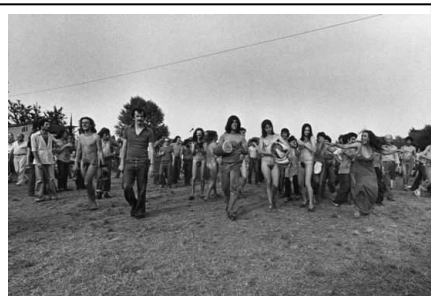
Gabriele Basilico Festa del proletariato giovanile Parco Lambro 1976

Il fervore politico e creativo della metropoli milanese si riflette sul territorio circostante, nei paesi dell'hinterland, profondamente trasformati dalle costruzioni massicce e disordinate che sorgono dappertutto per dare una casa agli immigrati in arrivo dal sud dell'Italia. In questi paesi, veri e propri quartieri dormitorio , alloggia la mano d'opera che riempie le fabbriche e i cantieri di Milano. I figli frequentano le scuole dell'obbligo e poi quelle superiori. Il dibattito culturale e politico entra negli istituti scolastici ed esce, rimodulato, nei quartieri e nei luoghi di lavoro. La fucina di queste idee è costituita dai collettivi, in cui si riuniscono giovani operai, impiegati e studenti che muovono da una critica radicale alla società e gettano i semi di una nuova cultura, ispirata ai temi libertari e che fa i conti con la rivendicazione dell' emancipazione femminile . San Donato e San Giuliano Milanese, a sud est della città, offrono un esempio significativo di questo fervore culturale, ideologico e sociale.