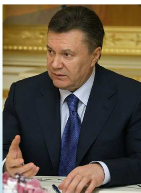
Viktor Yanukovich (Yenakiyev, Ucraina 1950)

Nel 1994 venne eletto presidente Leonid Kucma che ha avuto due mandati (1994/2004). Nel decennio di presidenza di Kucma si accentuarono le tendenze nazionaliste , giungendo a equiparare nazismo e comunismo, e si diede impulso alla privatizzazione/liberalizzazione dell'economia che portò, però, alla nascita di oligarchi e alla diffusione della corruzione. Il suo opportunismo , filo-ucraino nelle regioni a prevalenza ucraina, e filo-russo nelle regioni a prevalenza russa, lo portò in un vicolo cieco.