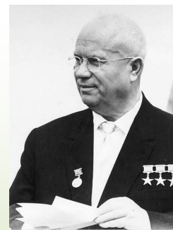
Nikita Sergeevich Khrushchev (Kalinovka, Russia 1894 - Mosca, 1971)

Negli anni Settanta/Ottanta l'Ucraina è stato un paese povero, pienamente integrato nel sistema di potere sovietico russo. Da ricordare l'esplosione della centrale nucleare di Cernobyl il 26 aprile del