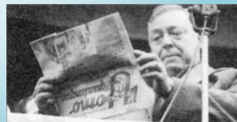
Guglielmo Giannini (Pozzuoli, 1891 - Roma, 1960)

Il settimanale di Giannini, quindi, sin dai primi numeri, non ravvisa differenze tra politici fascisti e antifascisti ; ostentando sfiducia in tutti i partiti politici , italiani e stranieri, non risparmia salaci invettive e si rivolge all'opinione pubblica moderata, così timorosa del cambiamento. " L'Uomo Qualunque " è perciò " l'uomo del caffè, del cinematografo, della sala da pranzo. E' l'antieroe che vuole vivere liberamente senza essere seccato, né coinvolto nelle beghe di potere. E' la Folla, la Maggioranza di buon senso, buon cuore, pacifica e laboriosa, amante del proprio benessere, ma troppo spesso vittima di guerre e privazioni operate dai professionisti della politica. " Sono inequivocabilmente i tratti di un individualismo cieco e chiuso in sé, che è indifferente all'impegno sociale e fortemente prevenuto