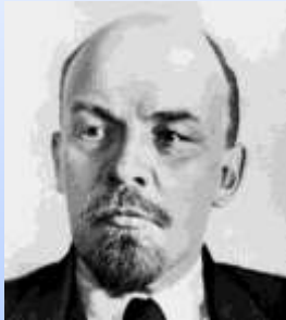
Lenin (Vladimir Il'ič Ul'janov) Ul'janovsk, 1870–Gorki Leninskie, 1924

Nella Comune: “la madre lavoratrice deve arrivare a capire che non è possibile fare differenze tra figli propri e quelli altrui, e deve ricordare che ci sono solo i nostri figli, i figli della Russia comunista lavoratrice”. Così, conclude la Kollontaj, “al posto dell’indissolubile e iniquo matrimonio si crea una libera unione da compagni tra due membri della società lavoratrice che hanno gli stessi diritti e che si amano. Al posto dell’egoista e chiusa cellula familiare cresce una grande famiglia internazionale dei lavoratori dove tutti i lavoratori, uomini e donne, diventeranno in primo luogo fratelli e compagni.”