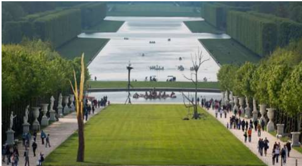
Il Giardino barocco francese Versaille, pendenze, canale e viale di carpini

Il nuovo paradigma inaugurato con l'Umanesimo e il Rinascimento si misura con eventi storici cruciali come la riforma protestante, le guerre di religione e la formazione degli stati nazionali. Il XVII secolo segna il definitivo passaggio all'epoca Moderna. E' il momento in cui nell'Europa continentale