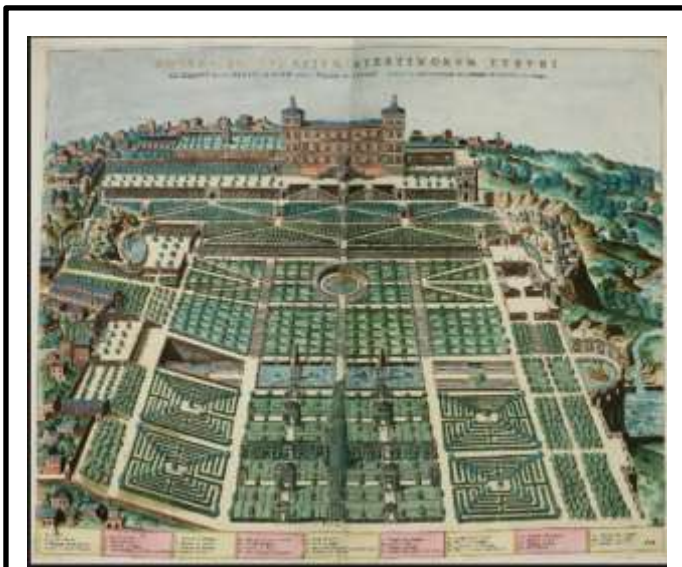
Il Giardino all'Italiana Villa d'Este, I giardini

L'epoca moderna registra un passaggio importante nella storia del giardino occidentale. L'uscita dal medioevo si realizza in concomitanza con la rivoluzione prodotta dall'Umanesimo e dal Rinascimento. Si tratta di movimenti culturali, presenti soprattutto nella penisola italiana, che provocano in Europa un capovolgimento di valori e la formazione di una nuova visione del mondo che assegna una centralità al soggetto umano . Quest'ultimo si emancipa dalla subalternità ai disegni divini (tipica della cultura religiosa dei secoli precedenti) a favore di una ritrovata fiducia nella capacità di risultare artefice del proprio destino. Dall'obbedienza alla provvidenza si passa alla celebrazione della abilità trasformativa dell'uomo, all'esaltazione dell'operosità e volontà del soggetto.