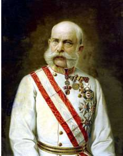
Francesco Giuseppe I d'Austria