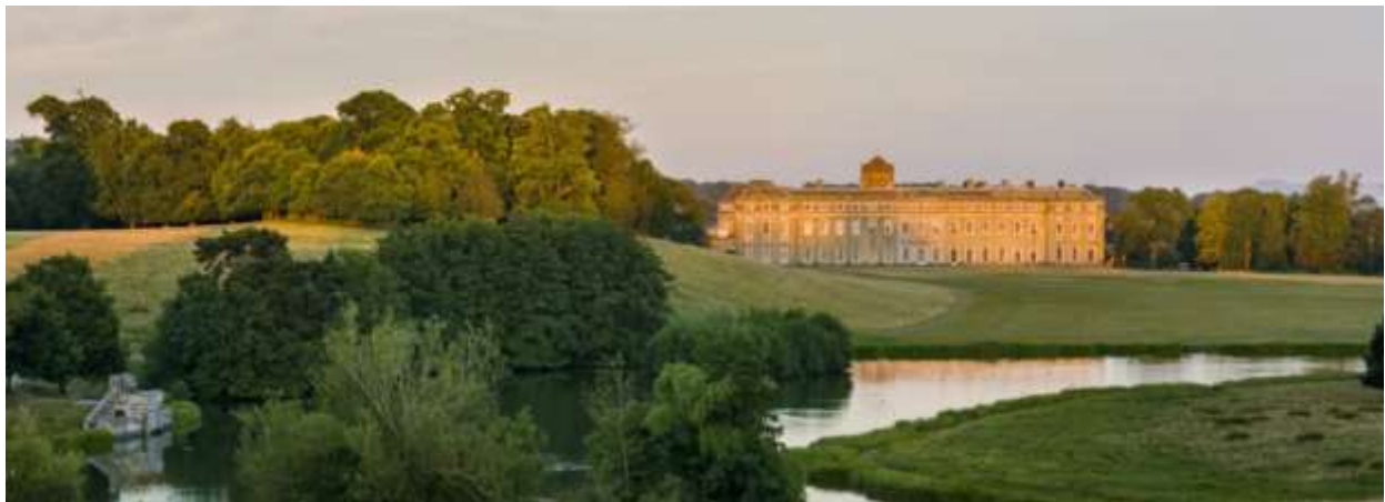
Il Giardino all'inglese Petworth House, Sussex

Questa tradizione formale del giardino, che dal modello italiano si evolve nel modello francese, viene messa in discussione nella prima metà del settecento in concomitanza con la supremazia politica raggiunta nel frattempo, in Europa, dall' Inghilterra. Questo spostamento di baricentro