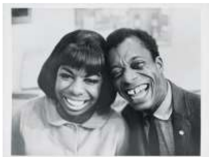
Nina Simone con James Baldwin

Da Mississippi Goddam in poi sono numerosissime le composizioni che Nina dedica alla causa del Movimento, così come le rivisitazioni di opere altrui che lei piega allo scopo. La sua fine