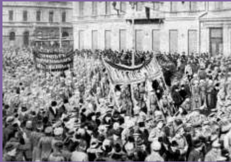
Manifestazioni San Pietroburgo luglio 1917

Inizia una campagna di rieducazione: a Mosca i lavoratori obbligano i padroni ad imparare le basi del futuro diritto operaio, a Odessa gli studenti dettano ai professori un nuovo programma di storia