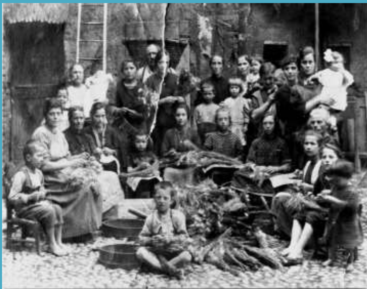
Famiglia contadina russa

Da sempre i contadini russi erano servitù della gleba. La famiglia contadina tradizionale era il dvor . Il termine dvor rappresentava l'istituzione costitutiva dall'ambiente domestico – abitazione granai, aia, bestiame ecc. – ma indicava anche il gruppo di individui che vi abitavano e vi lavoravano aventi, generalmente, rapporti di consanguineità. Così, sia la famiglia che l'ambiente domestico come spazio, erano entrambi dvor . Dvor era anche sinonimo di dom (casa).