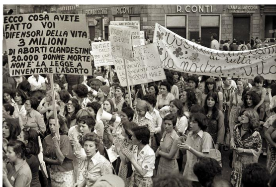
4 aprile 1977: manifestazione pro aborto a Roma

Con la legge n.108 "Norme per l'elezione dei consigli regionali delle Regioni a statuto ordinario" già approvata nel febbraio del 1968 e con la successiva n.281 del 22 maggio 1970 "Provvedimenti finanziari per l'attuazione delle Regioni a statuto ordinario" si poneva fine al lungo dibattito parlamentare sul tema, iniziato negli anni successivi alla nascita della Repubblica, e si rendeva effettivo quanto stabilito nel Titolo V della stessa Costituzione Repubblicana, ovvero il decentramento regionale delle funzioni amministrative dello Stato. Le leggi sono approvate dallo schieramento di centrosinistra escluso il Partito Liberale che si dichiara contrario. Contrari sono i pure i Monarchici e il Movimento Sociale Italiano. Il PCI è favorevole perché intravede nelle leggi il punto di partenza per la realizzazione di una democrazia diffusa e partecipativa . Le prime elezioni regionali si svolgono nel giugno del 1970 e da esse emerge un quadro al tempo stesso atteso e temuto dai partiti della maggioranza.