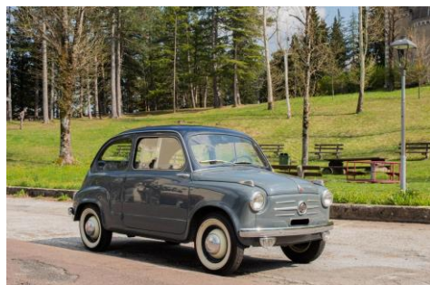
1955. Fiat 600

Anche la semantica aiuta a comprendere l'importanza dell'automobile che ora diventa "la macchina" per antonomasia. In precedenza il termine "macchina" evocava qualsiasi dispositivo meccanico.