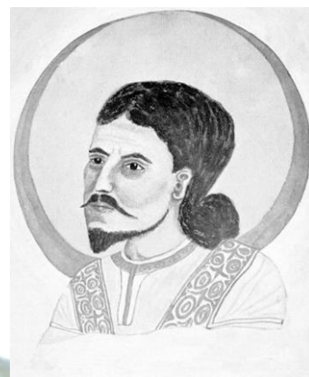
Mani (216-277 d.C. circa)

Il manicheismo porta alle estreme conseguenze il confronto tra principio del bene e principio del male già illustrato da Zarathustra : Mani predica una sorta di cosmologia dualistica tra il bene ed il male, rappresentanti il primo dalla luce e dal mondo spirituale, il secondo dalle tenebre e dal