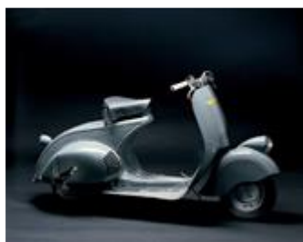
Pontedera nell'aprile del 1946

Fu sul trasporto su strada che lo Stato investì le maggiori risorse. Le strade e l'Autostrada del Sole hanno acquisito l'importanza che apparteneva alle ferrovie all'indomani dell'unità d'Italia. Il Piano Romiti del 1955 e il Piano Zaccagnini del 1961 motivarono la scelta autostradale con l'esigenza di adeguarsi al Mercato Comune Europeo e alla necessità di rilanciare il Mezzogiorno ma, soprattutto, per evitare la "strozzatura dell'industria automobilistica". Quindi, le autostrade dovevano servire non tanto ad assorbire i movimenti in atto, ma a generare nuovo traffico.