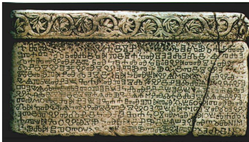
Il più antico documento scritto in glagolitico croato: Bašćanska ploča, la lapide di Bescanuova, intorno al 1100, isola di Veglia

Nell'opera di conversione degli Slavi occidentali dovette sostenere vivacissime diatribe anche con la chiesa cattolica fermento contraria alla traduzione dei testi sacri nelle lingue locali e fu a lungo imprigionato.