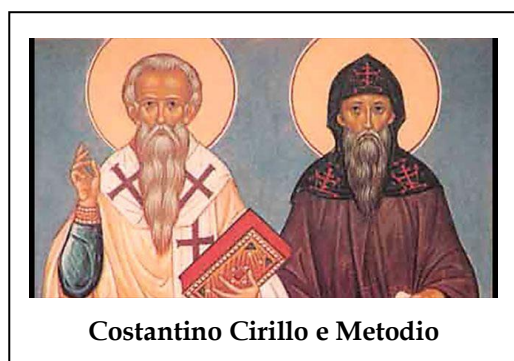
Costantino Cirillo e Metodio

Sia Bisanzio che Roma respingevano vigorosamente l'idea che si potessero tradurre i testi sacri negli idiomi barbarici. Per la Chiesa di Roma il latino era la lingua per eccellenza dei missionari cattolici. Solo in tempi recenti, infatti, le lingue nazionali hanno sostituito il latino nei messali (e tra le ben note proteste degli integralisti); in Francia, d'altro canto, i testi scientifici e le tesi di dottorato erano redatti in latino sino alla metà del XIX secolo. Lo stesso nei paesi slavi convertiti al cattolicesimo: Boemia e Polonia.