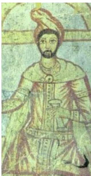
Immagine rinvenuta a Doura Europos (Siria), risalente al III secolo d.C., che, comunemente, viene intesa come quella del profeta iranico Zarathustra; più probabilmente indica "il Persiano", uno dei sette livelli di iniziazione del culto mitraico romano.