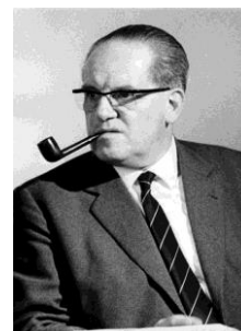
Herbert Wehner Dresda 1906- Bonn 1990)

Inoltre, il Manifesto della SPD (Grundsatzprogramm) confermava la difesa militare dei confini federali, la rottura con l'ideologia comunista, il superamento di una politica economica basata sulla collettivizzazione, accettando il libero mercato regolato dallo Stato, per difendere gli interessi della popolazione, e la proprietà privata come garanzia della libertà individuale e culturale.