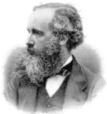
James Clerk Maxwell (Edimburgo, 1831 – Cambridge, 1879)

Maxwell osservò, anche a seguito delle intuizioni di Faraday, che se alimentiamo un condensatore con una corrente che cambia continuamente verso (ad esempio, una corrente alternata) le armature del condensatore cambiano continuamente di polarità, con una frequenza che è la stessa della corrente che alimenta il circuito. (come una membrana che sia sollecitata alternativamente in un senso ed in senso opposto)