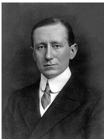
Guglielmo Giovanni Maria Marconi (Bologna, 1874] – Roma, 1937)