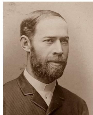
Heinrich Rudolf Hertz (Amburgo, 1857 – Bonn, 1894)

Nel 1894 Marconi, ventenne, autodidatta, con scarsi successi scolastici, ma con solida preparazione di base nel campo della fisica per aver frequentato i massimi esperti di quel tempo, si concentrò sulle esperienze di Hertz. La famiglia benestante, non gli aveva fatto mancare i denari per il suo hobby e per acquistare attrezzature elettriche. Introdusse l'antenna aerea e la presa di terra nel trasmettitore , fatto che permise un notevole aumento della capacità del sistema: le frequenze erano più piccole e quindi disponeva di lunghezze d'onda sempre più grandi. Solo in questo modo, almeno in un primo tempo, sarebbe stato possibile trasmettere segnali a distanza (in grado cioè di superare i dislivelli del suolo). In questo modo Marconi, alla fine del 1894, riuscì a trasmettere dei segnali elettrici (non in voce) alla distanza di 1.600 metri e, nell'agosto del 1895 fu estesa a 2.400 metri (esperimenti di Villa Grifone).