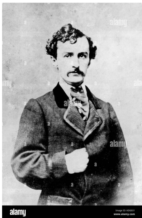
John Wilkes Booth (1838-1865)

L'incremento delle entrate fiscali ed il parallelo sviluppo dell'economia misero la cartamoneta, il dollaro, al riparo da ogni rischio di svalutazione, anzi, l'aumento del circolante fece da propulsore ad investimenti, finanza e commercio; insensibilmente, senza che nessuno se ne rendesse conto, si veniva ad affermare quanto sarà in futuro oggetto delle moderne teorie monetaristiche, cioè che il valore della cartamoneta non è l'espressione di una parità, vera o presunta, con il metallo di riferimento (di solito l'oro), ma dell'equivalenza del circolante con il volume globale di prodotti e servizi generati dall'economia.