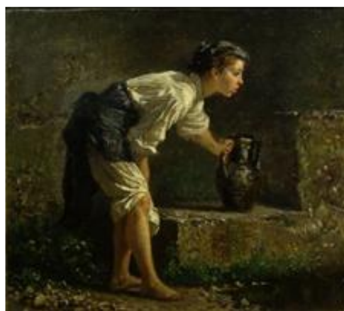
Giovinetta alla sorgente

Sembra che a questo comportamento le ragazze abdicassero fin dall'inizio delle loro storie, iniziate all'improvviso e abbastanza casualmente. Il futuro seduttore le aveva adocchiate durante uno dei loro spostamenti da casa al luogo di lavoro o per qualche commissione ai padroni, nel caso fossero a servizio, dato che il ritrovarsi per strada senza uno scopo preciso era assolutamente improbabile. Anche se, dalle parole dell'accusatrice, il rapporto iniziava sempre con le caratteristiche della sopraffazione - poiché la scelta e la decisione era sempre dell'uomo - l'assecondare o anche solo l'accorgersi dei cenni rivolti era senz'altro un'imprudenza. Dopo il primo scambio di occhiate, negli incontri successivi l'uomo iniziava una serie di dichiarazioni fino ad arrivare a parlare di matrimonio. Allora la ragazza sembrava scuotersi dalla sua impassibilità e cominciava a far presenti le evidenti difficoltà, o le condizioni cui doveva sottostare l'innamorato, prima di compiere il passo decisivo.