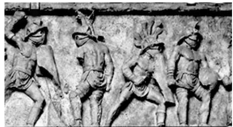
Rilievo di pugne in cui combattevano coppie di gladiatori

Sempre durante il II secolo a.C. la dimensione spettacolare gladiatoria cominciò a prevalere sull'ambito religioso e a divenire strumento della vita politica: i munera erano spesso offerti da candidati alle elezioni al fine di ottenere i voti dei cittadini. In età imperiale i munera spesso venivano offerti dall'imperatore: le insegne imperiali (la corona e parte del vestiario imperiale, il globo crucigero, lo scettro, la spada imperiale, la spada cerimoniale, la Croce imperiale, la lancia sacra e tutti i reliquiari) erano esibiti nella processione, pompa amphitheatralis , che descriveremo più avanti e che apriva lo spettacolo. Anche nelle province, tali processioni, benché non ricche come a Roma, esponevano statue e immagini degli imperatori come parte del culto imperiale.